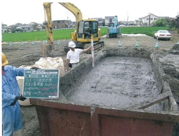
高含水比泥土改良例