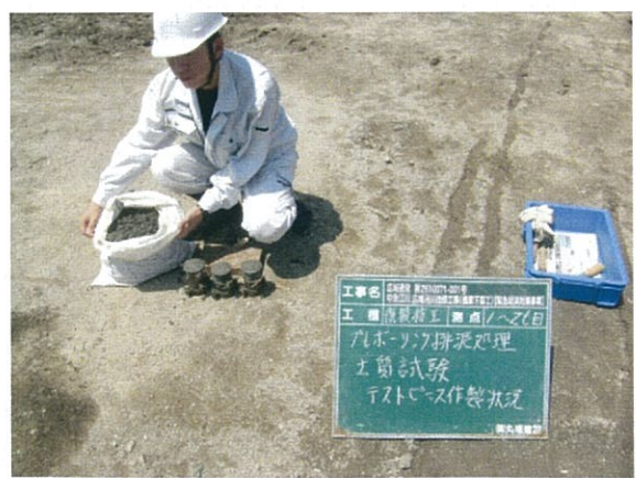
土質試験(テストピース採取)