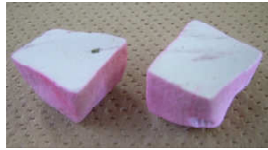
非吸水性ミラクルソルのカット断面 (骨材内部へ水分が浸透しない)