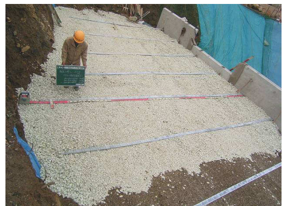
写真-1 補強土壁との併用事例