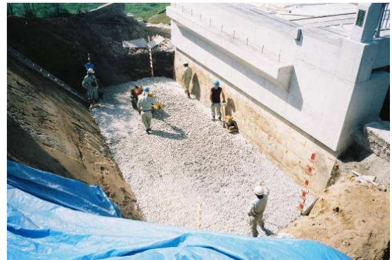
写真-2 既設橋台背面での施工事例