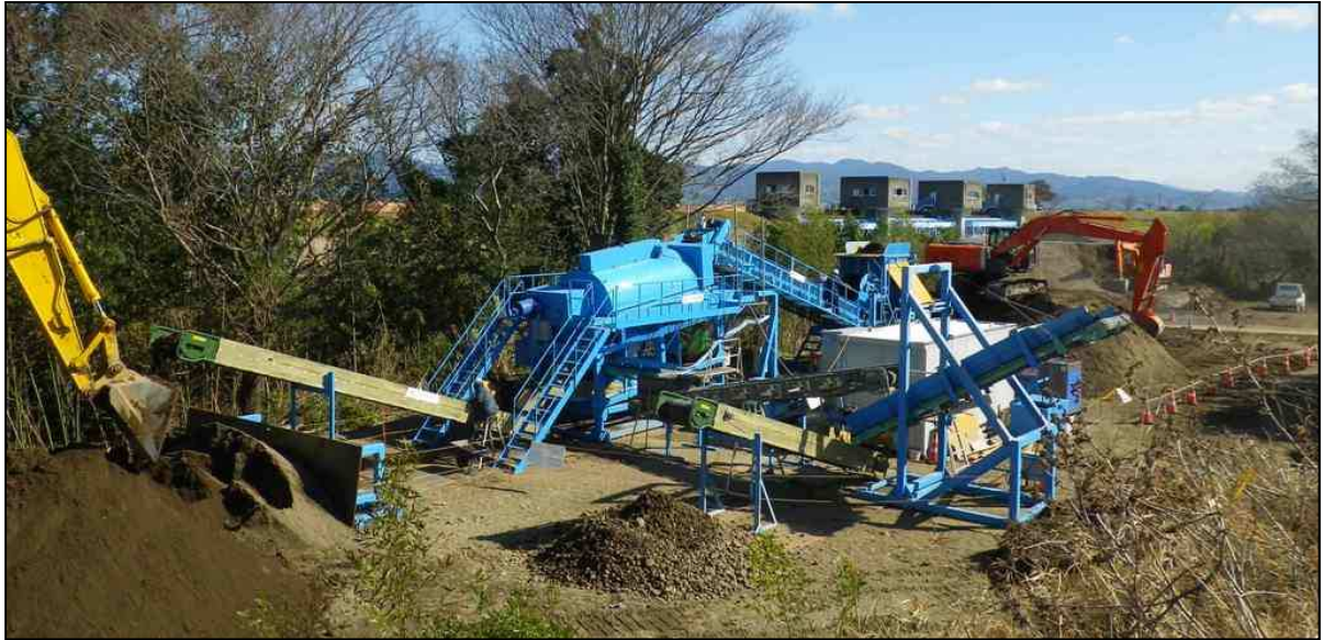
写真1-「すきとり表土」分別工法 全景