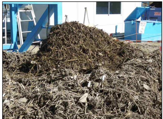
写真3-分別後草根茎