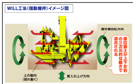
図-3 揺動攪拌イメージ図