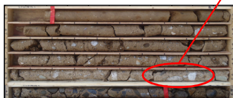
写真-3 改良体の礫取り込み状況