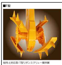
粘性土対応型:T型リボンスクリュー攪拌翼