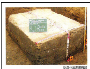
写真-2 改良体出来形