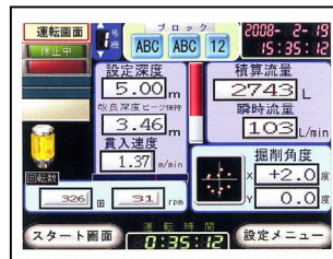
図-4 施工管理装置表示例