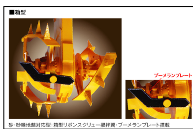
砂・砂礫地盤対応型:箱型リボンスクリュー攪拌翼、ブルーメンプレート搭載