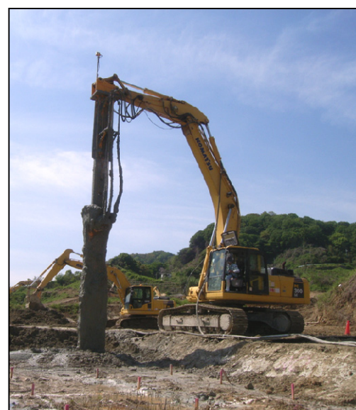
写真-4 10m仕様改良機施工状況