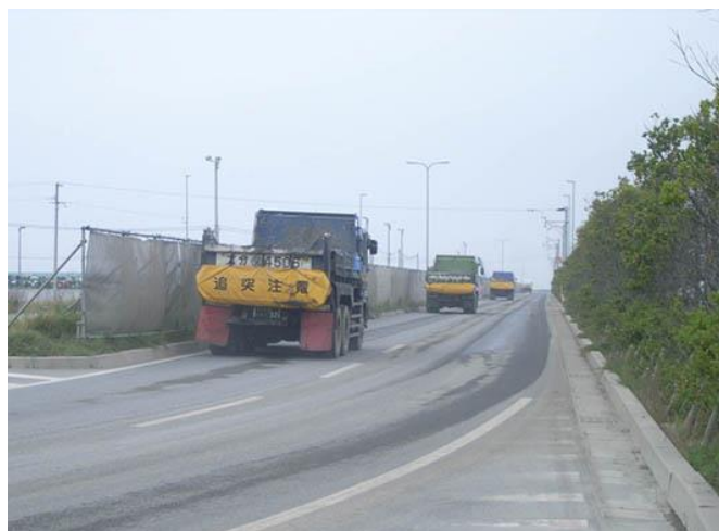
「ダンプトラック濁水落下防止カバー」有り

泥土ダンプ運搬における「ダンプトラック濁水落下防止カバー」有無の運搬路面状況比較を以下の写真に示します(「泥土」の含水比は約40(%))。「ダンプトラック濁水落下防止カバー」有り”の場合は写真における運搬路面上の白線がはっきり見えますが、「ダンプトラック濁水落下防止カバー」無し”の場合は白線が見えないほど濁水の落下・飛散により路面が汚されています。この写真の比較より、「ダンプトラック濁水落下防止カバー」による運搬路への濁水落下・飛散が防止されていることがわかります。