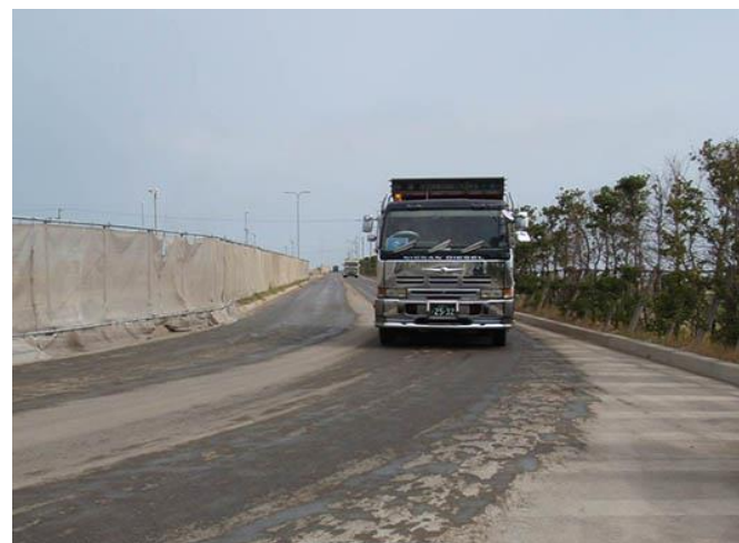
「ダンプトラック濁水落下防止カバー」無し