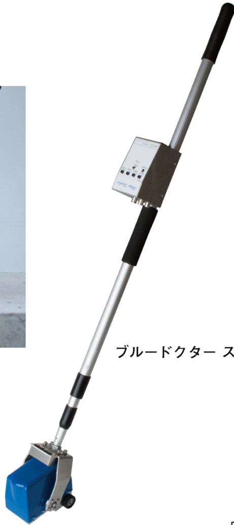
ブルードクター スティック型