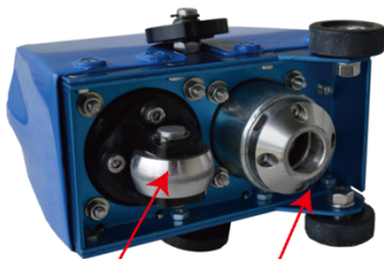
センサー 電磁ハンマー