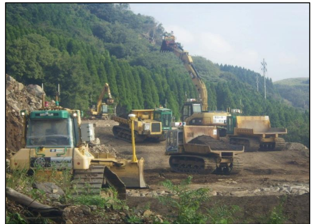
土留盛土工無人化施工状況