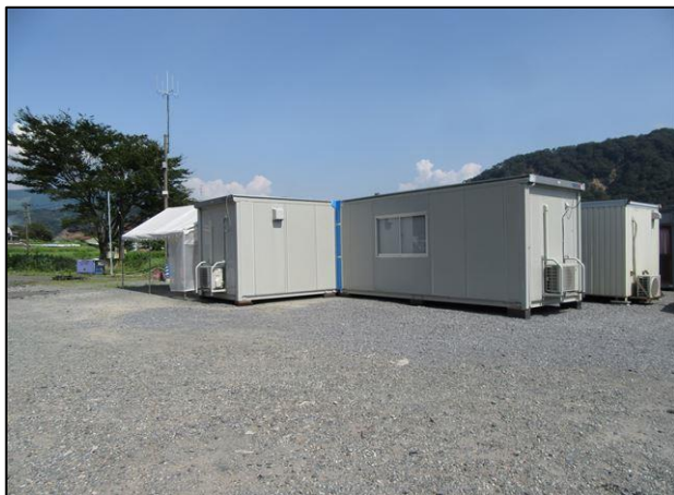
超遠隔操作室外観