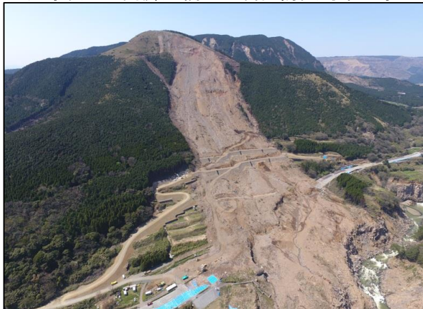
無人化施工エリア全景