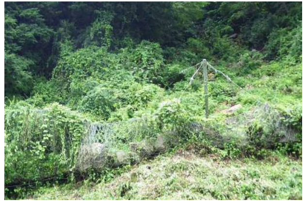
熊本地震落石捕捉実績