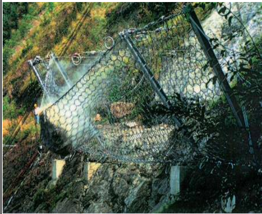
実物大落石実験RXシリーズ(250~30,00kJ)対応