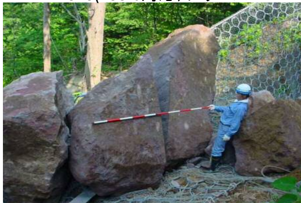
巨大落石捕捉実績