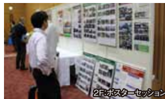
2Fポスターセッション