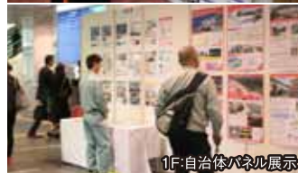
1F自治体パネル展示