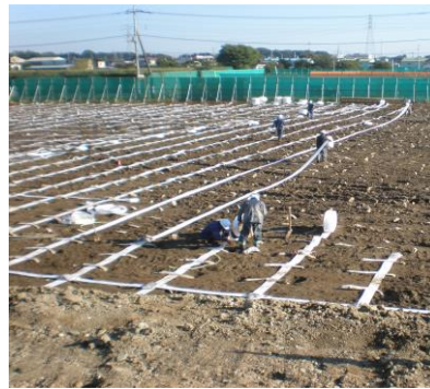
写真-2.2 水平ドレーン布設状況