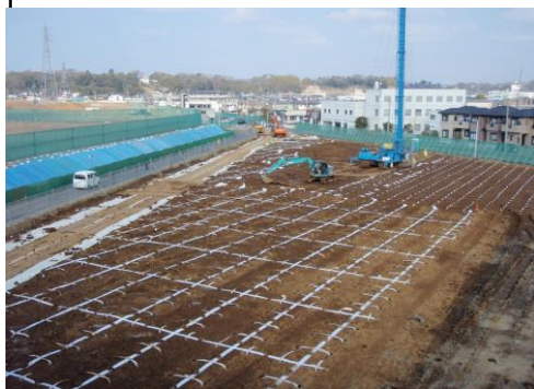
写真-2.1 水平ドレーン布設状況