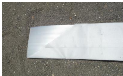
写真-1.2 鉛直ドレーン(生分解性)