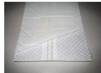
写真-1.3 水平ドレーン(生分解性)