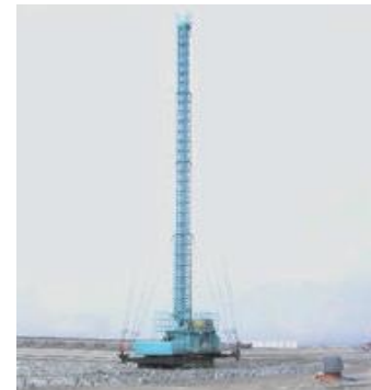
写真-2.3 鉛直ドレーン打設機