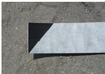
写真-1.1 鉛直ドレーン(再生材)