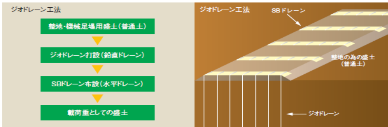
図-1 ジオドレーン工法施工フロー