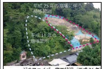
ジオファイバー施工状況 (平成 26 年)