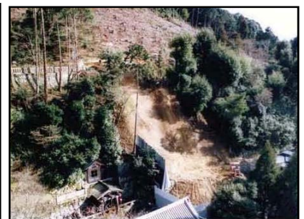
平成 11 年の斜面崩壊