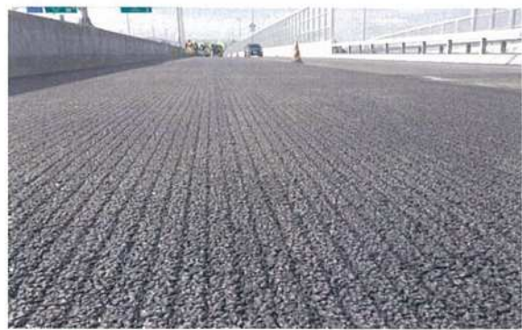
仕上がり路面の例 (福岡都市高速)