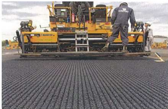
シニックスクリードによる敷均し状況