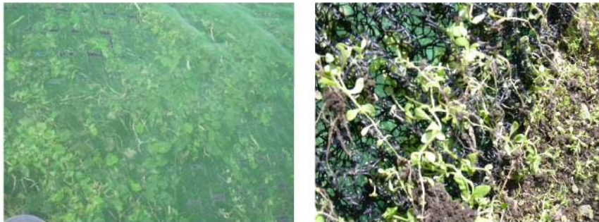
《マット内部の植生状況》