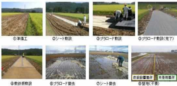
○プラロード作業手順