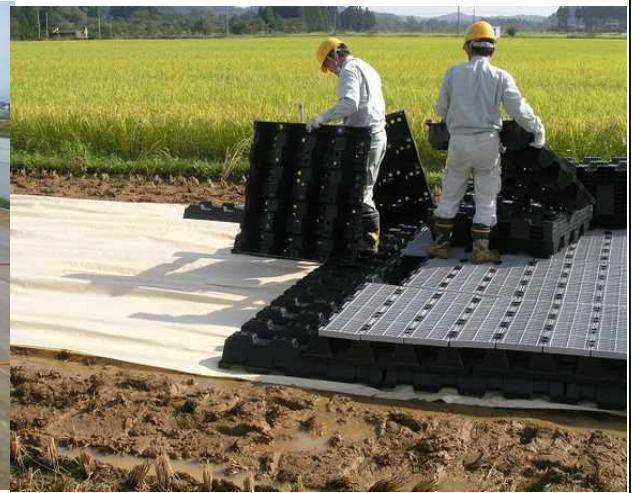
○プラロード敷設写真