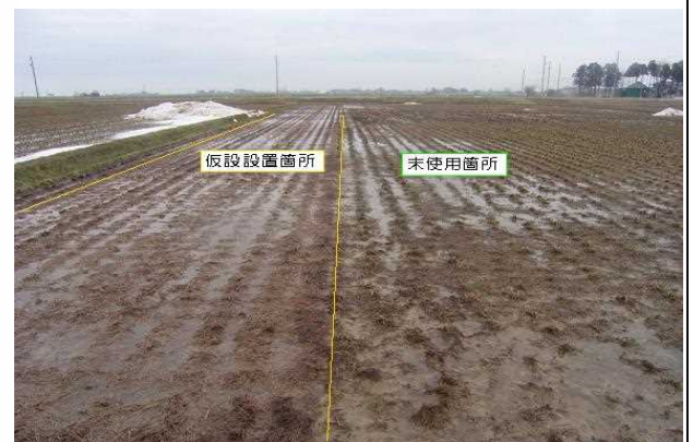
写真③ プラロード撤去状況(きわめて簡単・残材及び痕跡が残らない)