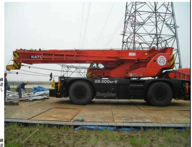
写真② 仮設道路供用50tラフター走行