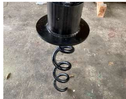
写真-2 スパイラルアンカー