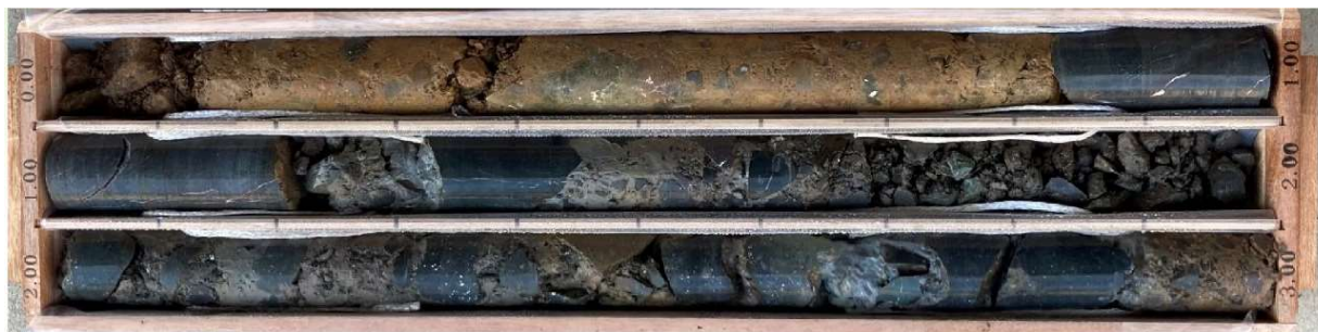
QSボーリング工法で採取したコア