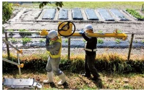
写真-1 人肩運搬状況