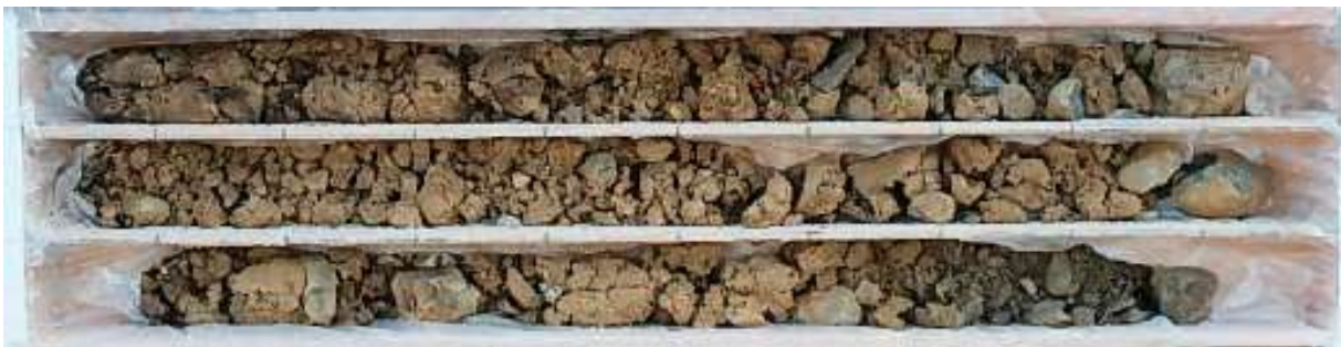
打撃式簡易ボーリングで採取したコア