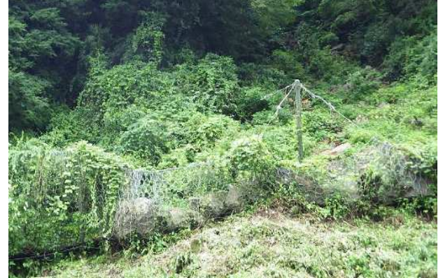
熊本地震落石捕捉実績