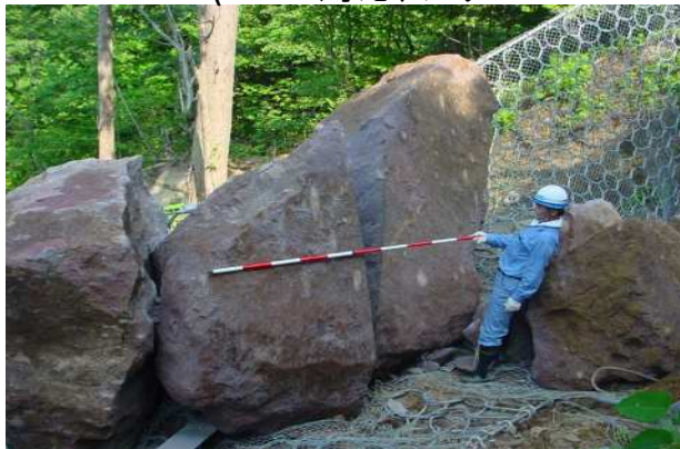
巨大落石捕捉実績