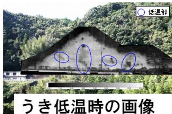
図-3 浮き撮影例(法面)