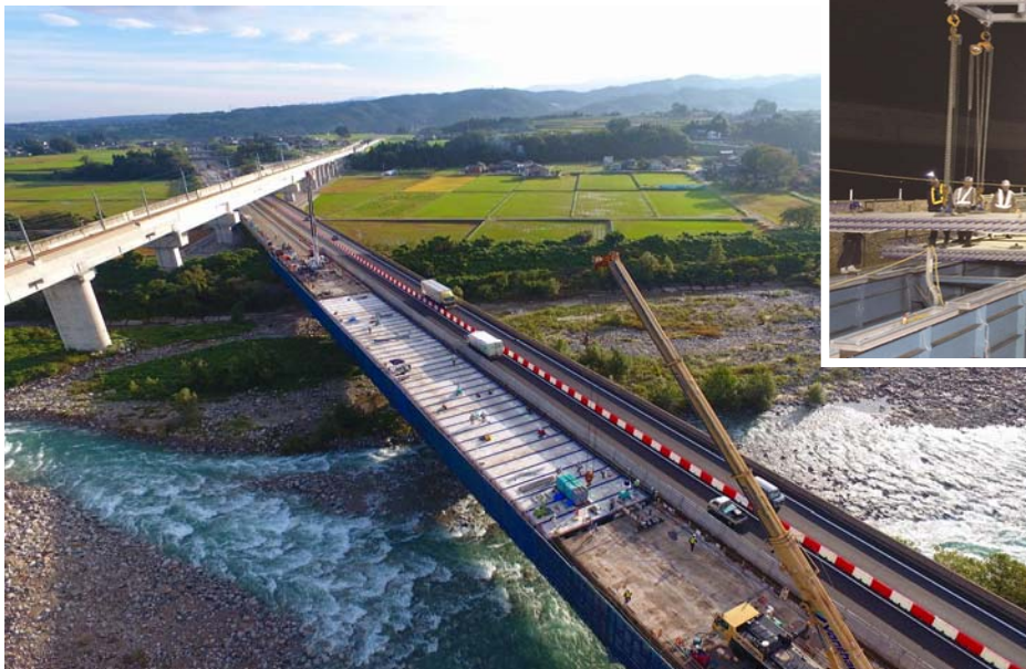
高速道路橋の床版取替え