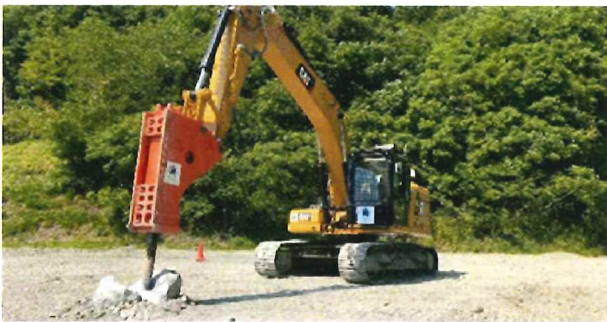
T-iROBO Breaker 自動走行・割岩作業用ブレイカー搭載油圧ショベル