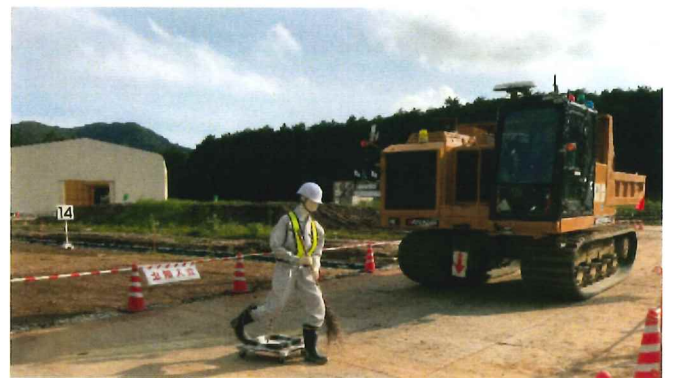
T-iROBO Crawler Carrier 自動走行・土砂運搬・排土クローラーダンプ