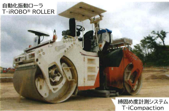
締固め度計測システム T-iCompaction