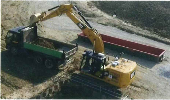
T-iROBO Excavator 自動掘削・積込油圧ショベル