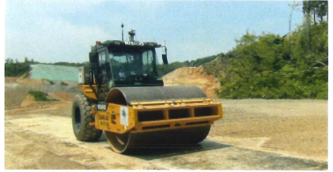
T-iROBO Roller 自動走行・転圧作業振動ローラー