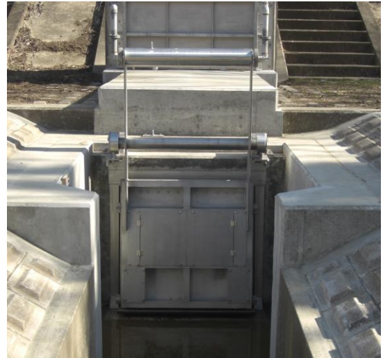
幅1.3m × 高1.3m 西郷廻樋管 愛知県 豊橋市