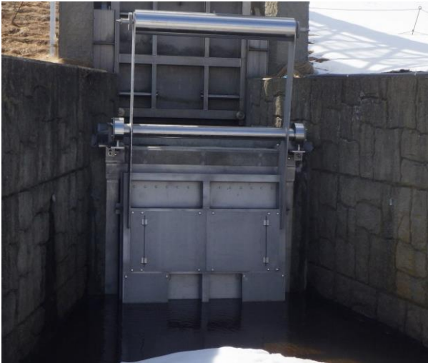
幅1.5m × 高1.5m 茂岩樋門 北海道開発局 帯広開発建設部