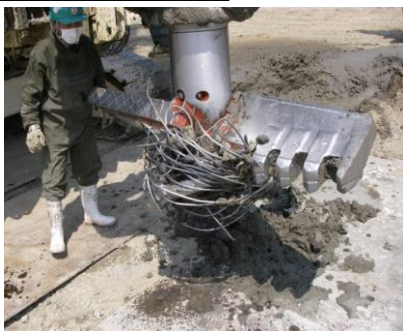
耐衝撃・耐摩耗 (Taf仕様)