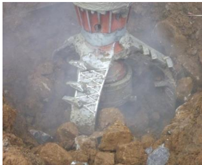
低速回転・高トルク