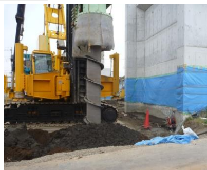
低速回転・スパイラルロッド