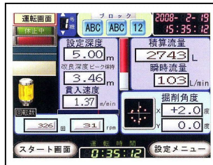
施工管理装置表示例(標準画面)