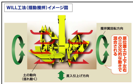
振動攪拌イメージ図