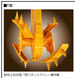
リボンスクリュー攪拌翼