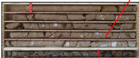
改良体出来形およびボーリングコア