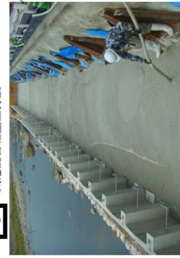
8 気泡混合軽量土打設