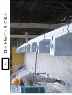
6 ロッド締付トルク導入