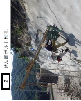
2 セン断ポルト削孔