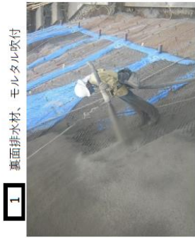
1 裏面排水材、モルタル吹付