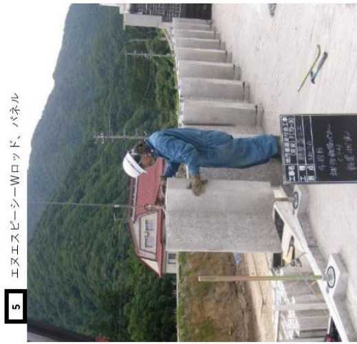
5 エヌエスピーシーWロッド、パネル