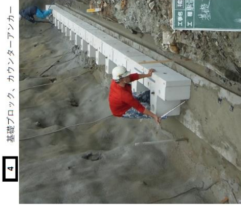
4 基礎ブロック、カウンターアンカー